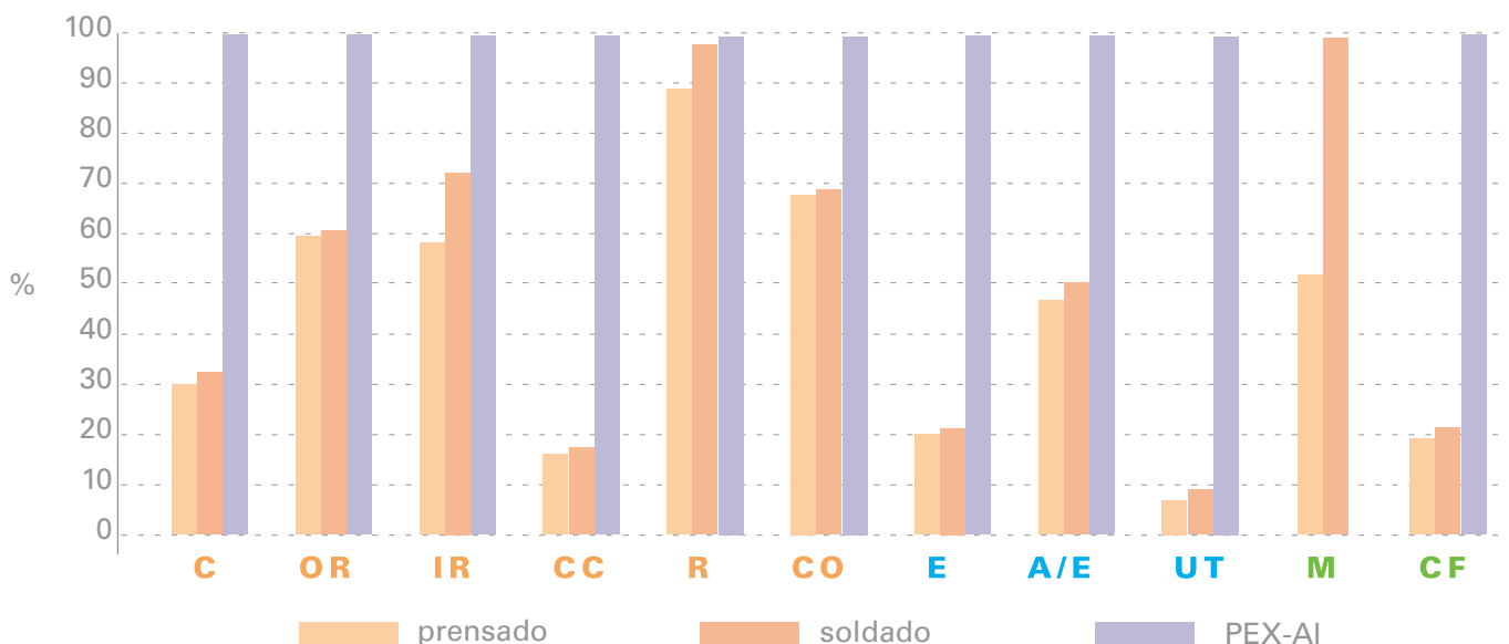
Gráfico comparativo evaluación del daño del ciclo de vida de las instalaciones